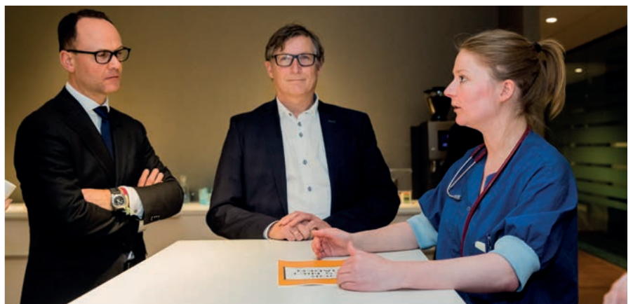
Zorg & Welzijn pensioendeelnemers in gesprek met hun pensioenfonds PFZW.

De vragen die we stellen aan fondsen leiden tot inzicht bij de fondsbestuurders en investeerders. Inzicht dat investeringen meer zijn dan een getal op een spreadsheet. Dat duurzaamheid een integraal onderdeel is van investeringsbeslissingen. En dat investeren in fossiel ook financieel een risicovolle investering is. Concreet heeft dit al geleid tot meer transparantie over beleggingen. Belangrijk, want veel fondsen maken niet eens openbaar waar zij pensioengeld in beleggen. Dat maakt ze minder afrekenbaar.